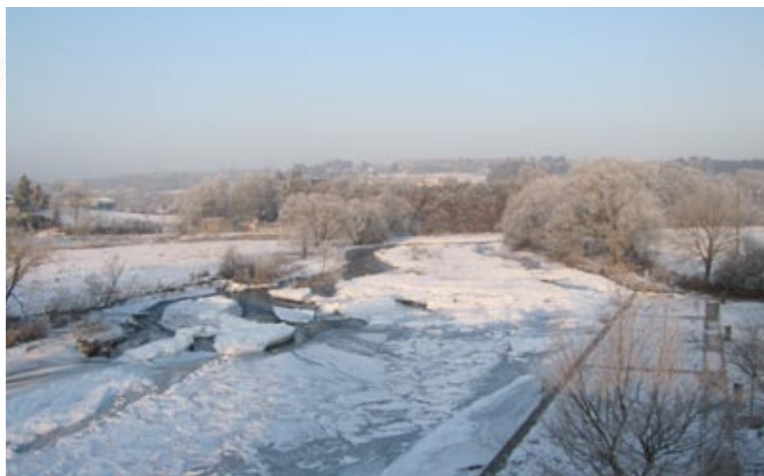
En couverture : A la découverte du castor au Bec du Feyi