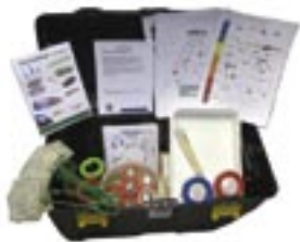
Malle «indice biotique»

Intéressés par l'une de nos animations? Contactez-nous pour réserver une animation ou emprunter l'une de nos malles.