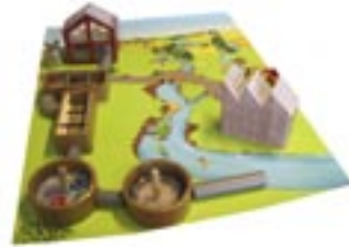
Malle «step by step»

On rencontre diverses sortes d'écrevisses dans nos cours d'eau. Qui sont-elles? Que mangent-elles? quelle vie mènent-elles? ... Rentrez dans leur peau et voyez comme la mue est difficile.