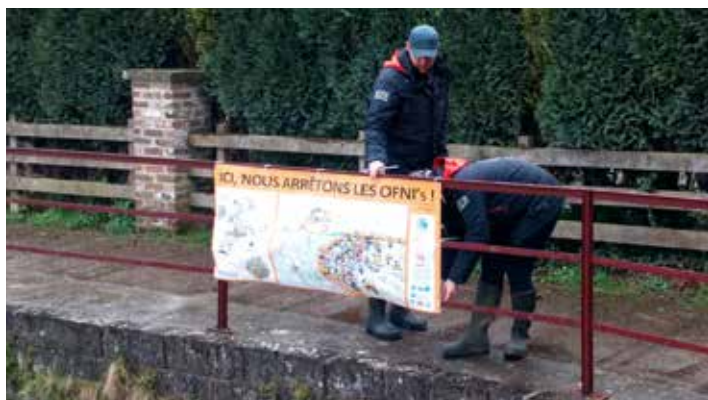
Placement du barrage pour arrêter les OFNI sur le Néblon