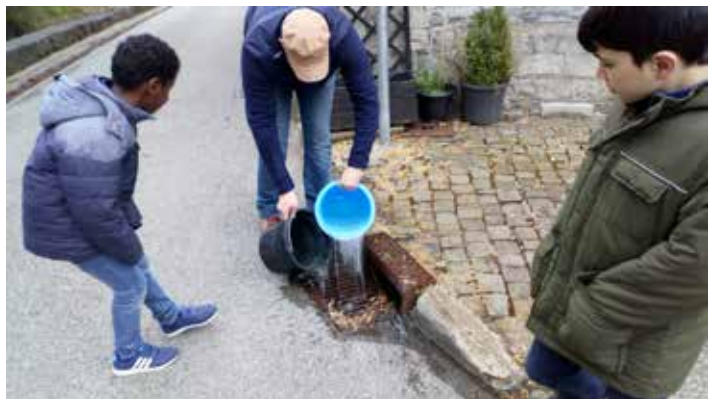
Animation Rivière et déchets à Hamoir