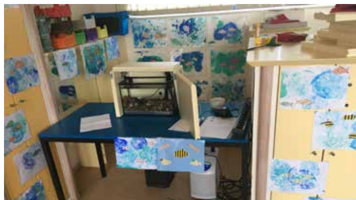
Animation Saumon en classe à Borlon