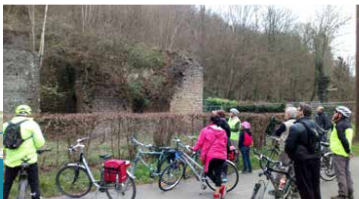
Balade à vélo à la découverte de l'histoire de la navigation sur l'Ourthe (Esneux)