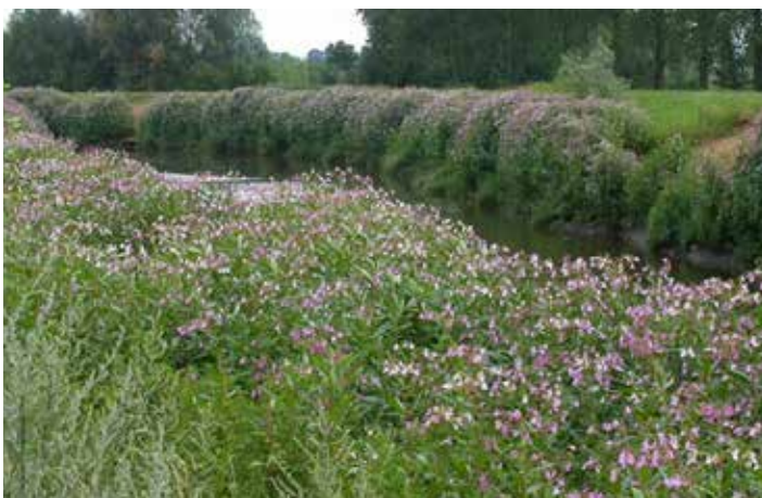
Populations monospécifiques de balsamines de l'Himalaya et de berces du Caucase

www.biodiversité.wallonie.be/fr/invasives.html