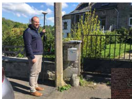
Report des repères de crue en un endroit accessible au public (Chanxhe - Poulseur)