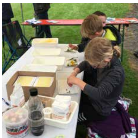
Stand lors de la fête du Parc Naturel des Deux Ourthe (Givroule)