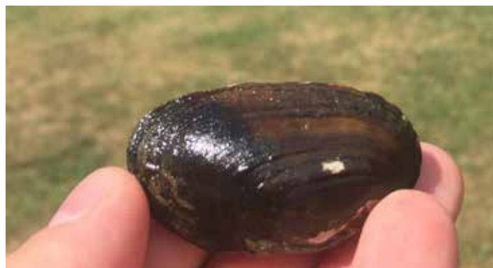
Au hasard d'une pose, ils découvrent une coquille de moule épaisse à Hamoir, de quoi compléter l'inventaire des sites potentiels!