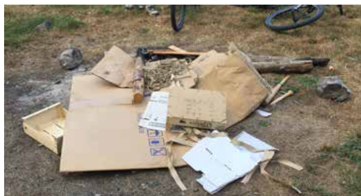
Alors même que les feux sont interdits en province de Luxembourg pour cause de sécheresse, ils n'est pas rare pour nos stewards de tomber sur ce genre de déchets.

2 River stewards 22 jours de travail Présence sur le terrain du mardi au samedi à pieds ou à vélo entre Maboge et Liège 1945 interventions de 11 à 216 interventions par jour Budget 3800 euros