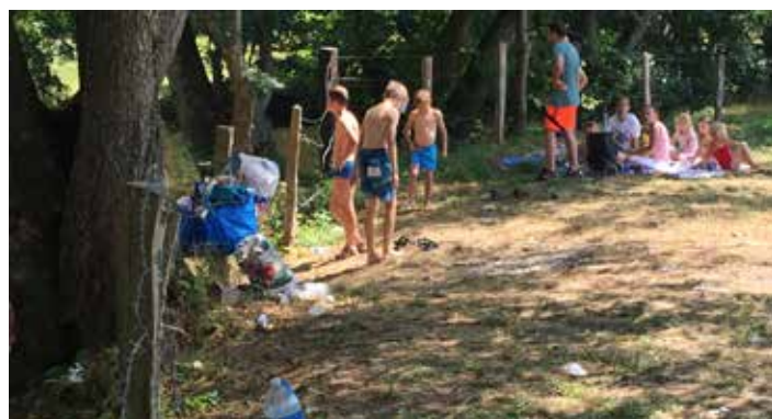
Baignade sauvage: il y a des choses à ne pas faire... ! Pour accéder plus facilement à l'eau, les clôtures du prés sont coupées et les déchets sont abandonnés sur place!