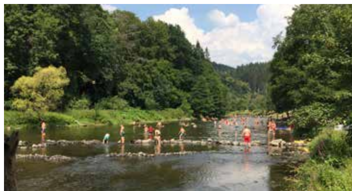
Ce jour-là, à Maboge (plage où la qualité de l'eau est excellente et contrôlée chaque semaine), ils ont eu du travail pour rencontrer un maximum de personnes!